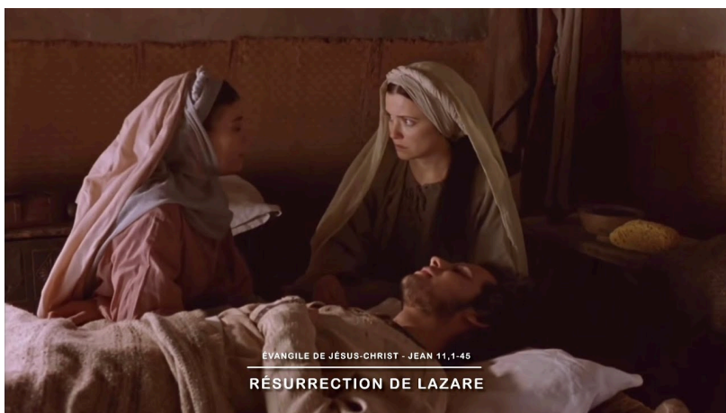
EVANGILE DE JÉSUS-CHRIST - JEAN 11,1-45 RÉSURRECTION DE LAZARE