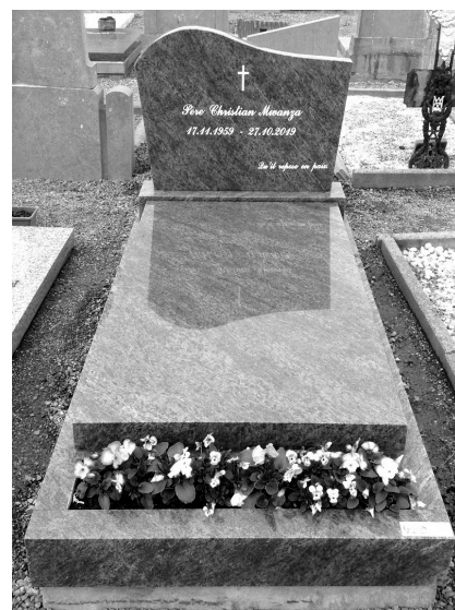
Tombe de l'abbé Christian